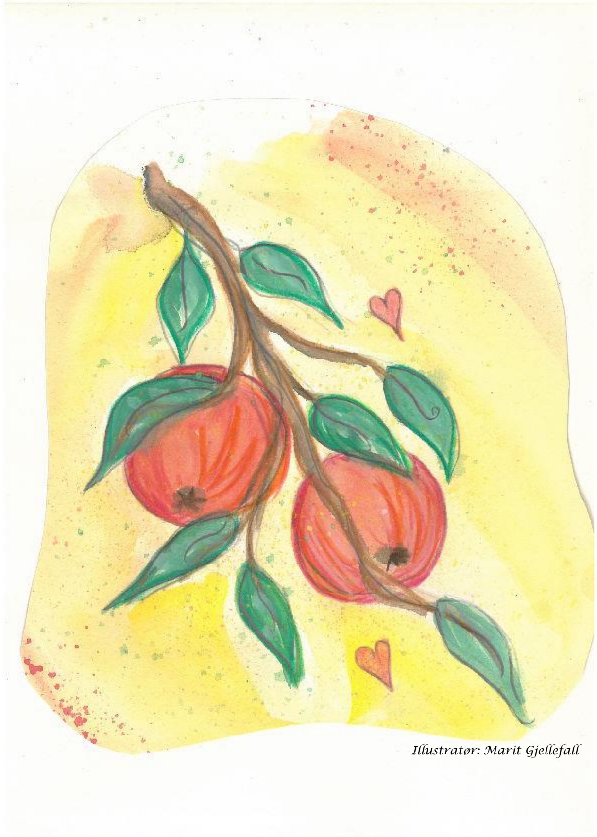
Illustrator: Marit Gjellefall